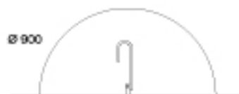
BOLLARD 900 MEDIA ESFERA