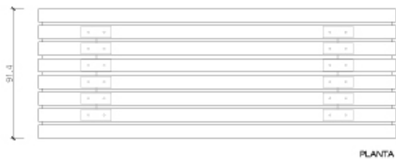
CONJUNTO MESA Y BANCOS TRAMET