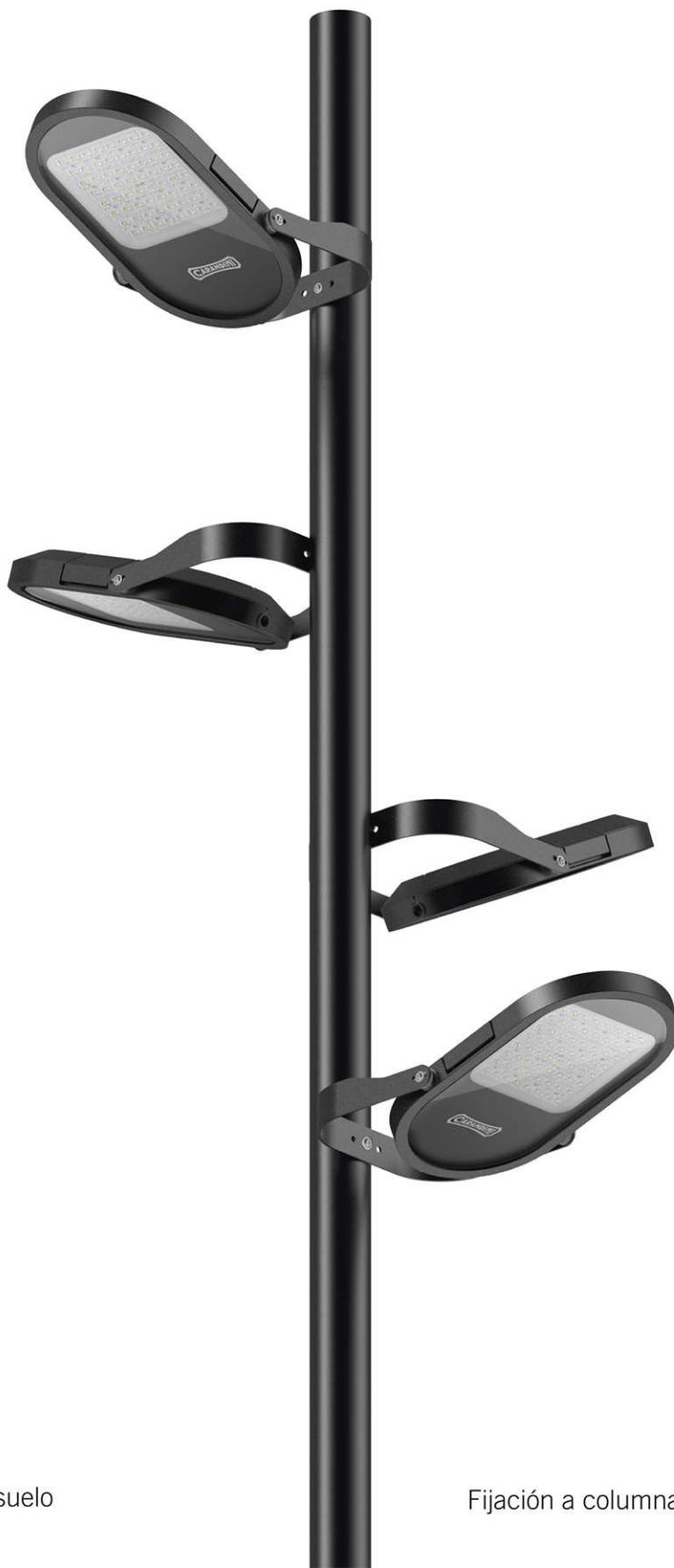
Fijación a columna