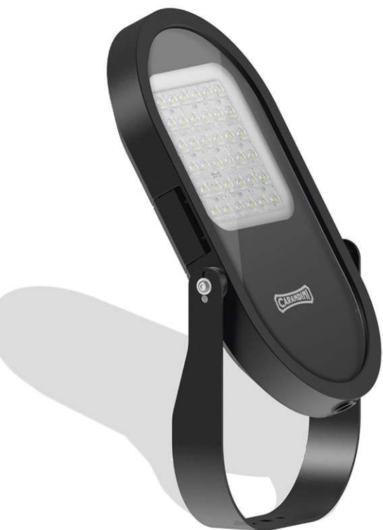
Fijación a suelo