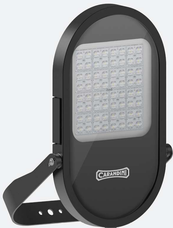
MIKOS M De 6.000 a 18.000 lm Disponible en Mayo 2020