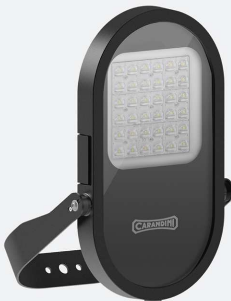
MIKOS S De 1.000 a 9.000 lm Disponible en Mayo 2020